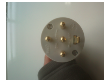
PC 20 ampères tri + neutre (J)