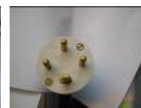
PC tri 32 ampères (F)