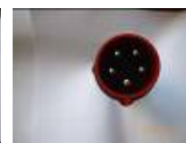
PC tri + neutre 32 ampères (D)