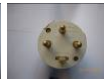
PC tri 20 ampères (H)