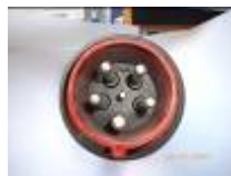
PC tri+ neutre 63 ampères (G)