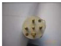
PC tri + neutre 32 ampères (I)