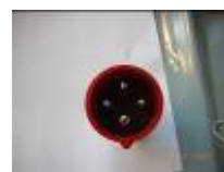
PC tri 16 ampères (B)