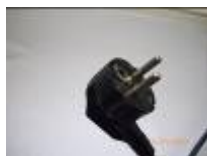
PC mono 220 volts 16 ampères (A)

Si vous ne connaissez pas la puissance en Watts prenez en photo la plaque signalétique de l'appareil électrique