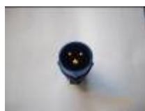
PC mono 16 ampères 220 volts (C)