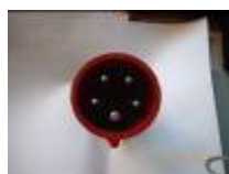
PC tri + neutre 16 ampères (E)