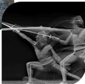
20 MAI PHOTOGRAPHER LE SPORT