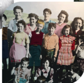
13 MAI IMAGES TRANSFORMÉES