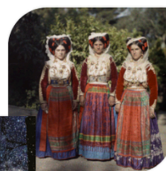
30 MAI PHOTOGRAPHIE AU MUSÉE