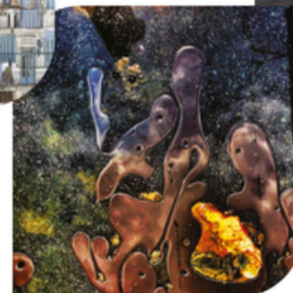
27 MAI REGARDS CONTEMPORAINS