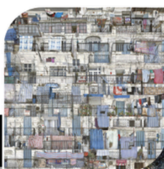
23 MAI PHOTO- GRAPHIE