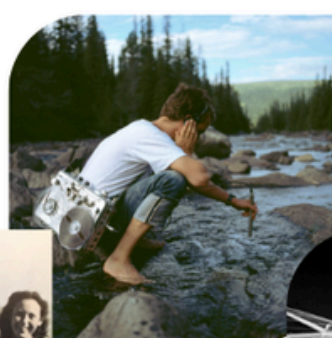
16 MAI NATURE EN IMAGES